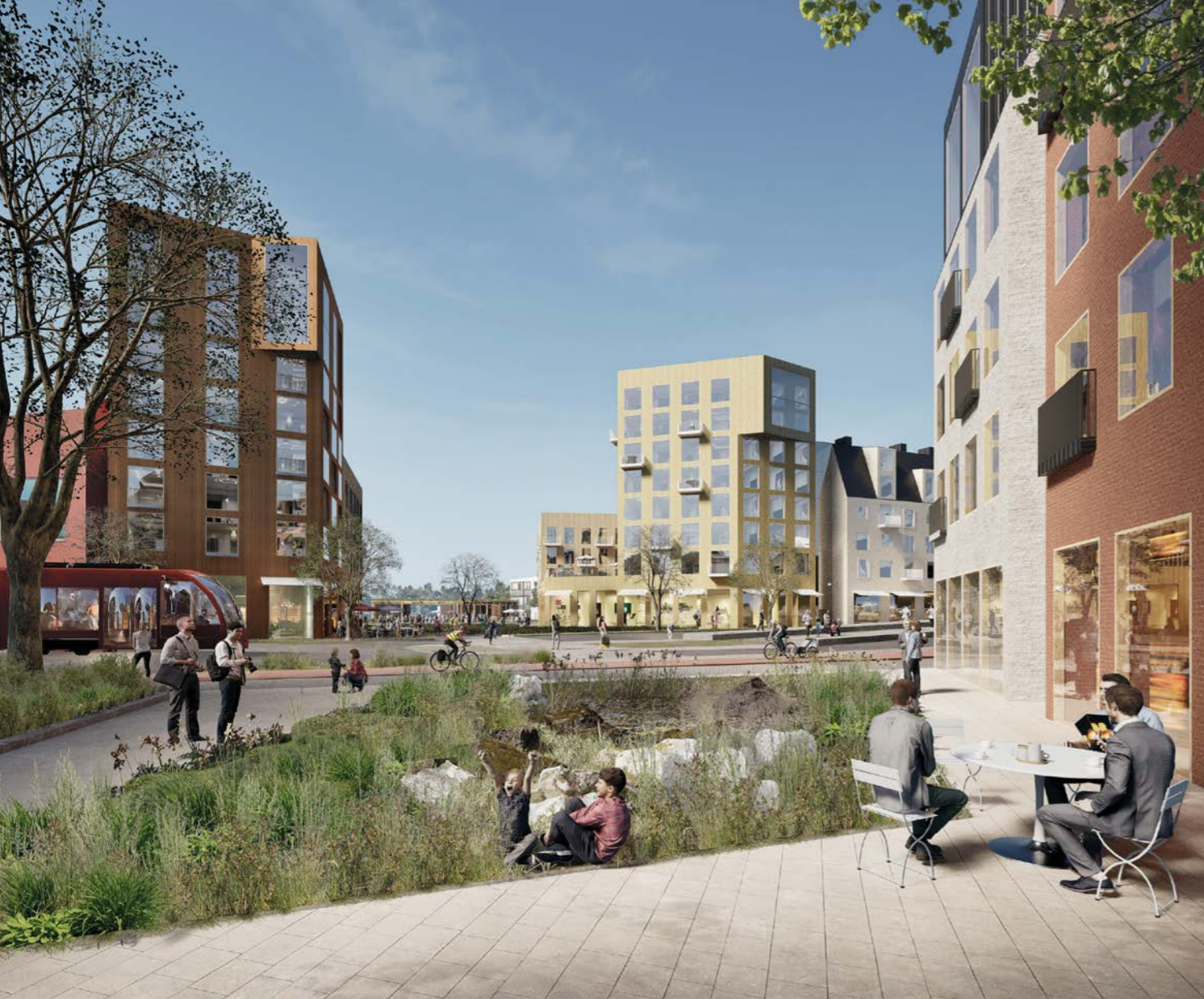
Vuoresaukio nähtynä Vuoreksen puistokadun länsipuolelta / Vuoresaukio as seen from the west side of Vuoreksen puistokatu street