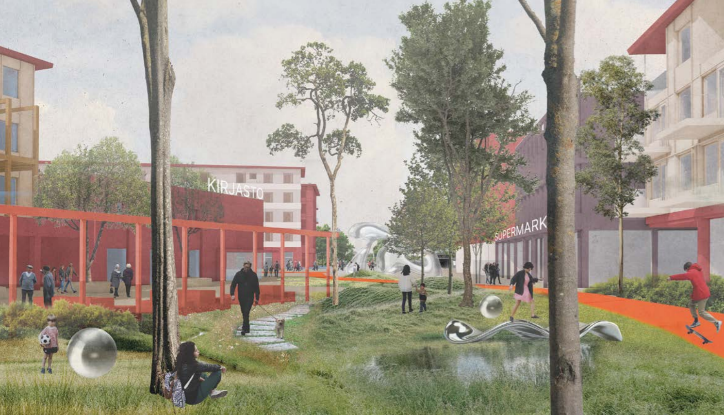
näkymä Vuoresaukiolta / view from Vuoresaukio