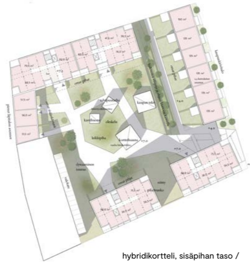
hybridikortteli, sisäpihan taso / hybrid block, courtyard level 1:1500