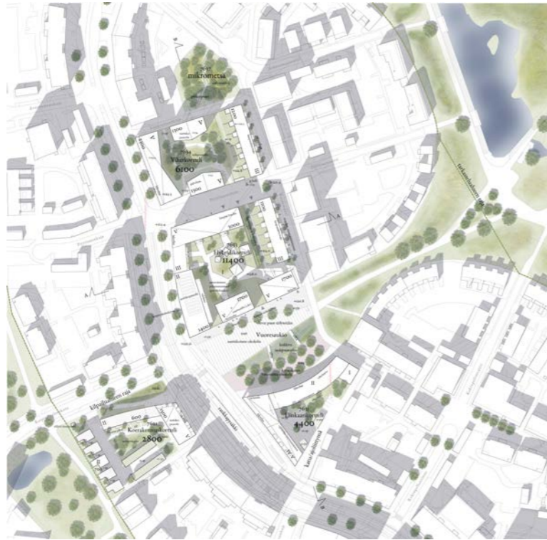
yleissuunnitelma / general plan 1:4000