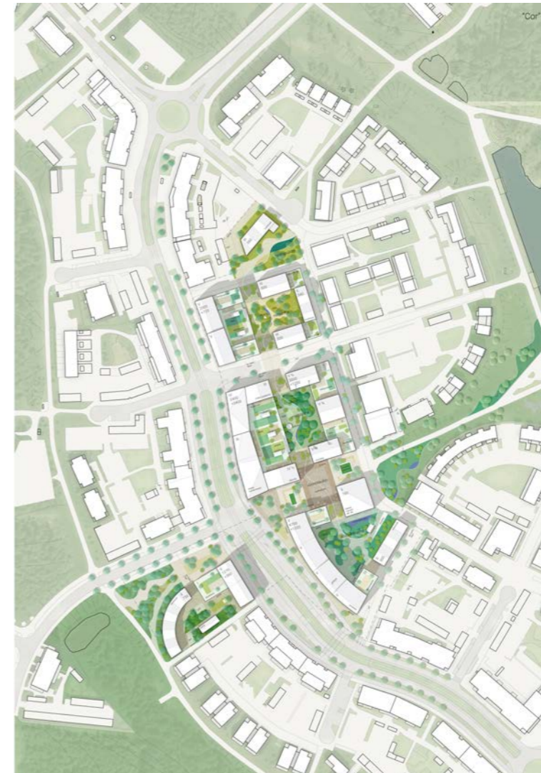
yleissuunnitelma / general plan 1:4000

tekijät / authors: Arkkitehtitoimisto Karin Krokfors Oy – KARIN KROKFORS arkkitehti SAFA, kaupunkisuunnittelun professori HEIKKI MYLLYNIEMI arkkitehtiylioppilas asiantuntijat / specialists: ELISA LÄHDE maisema-arkkitehti MARK, maisema-arkkitehtuurin apulaisprofessori avustajat / assistants: MARCO RODRIGUEZ CHAVEZ arkkitehti visualisointi / visualisations: Vivid Vision