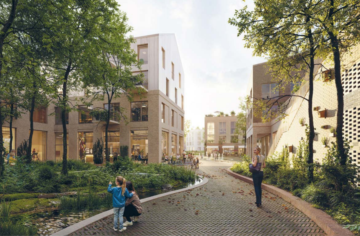
näkymä korttelipihalta Vuoresaukiolle / view from a courtyard towards Vuoresaukio