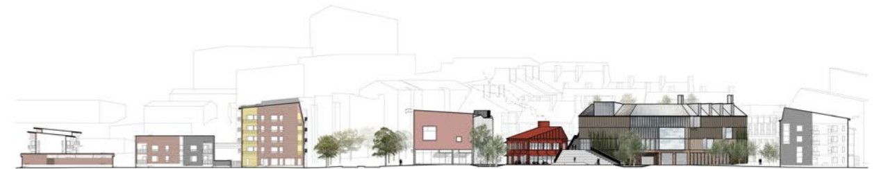
aluejulkisivu / elevation, Vuoresaukio 1:1500

Parking is mainly concentrated in the hybrid building. There is also some scattered ground-level parking in the blocks, which is a cost-effective solution but in places significantly reduces the appeal of the courtyards. Courtyards without any subterranean construction are nevertheless a good solution in terms of trees and stormwater.