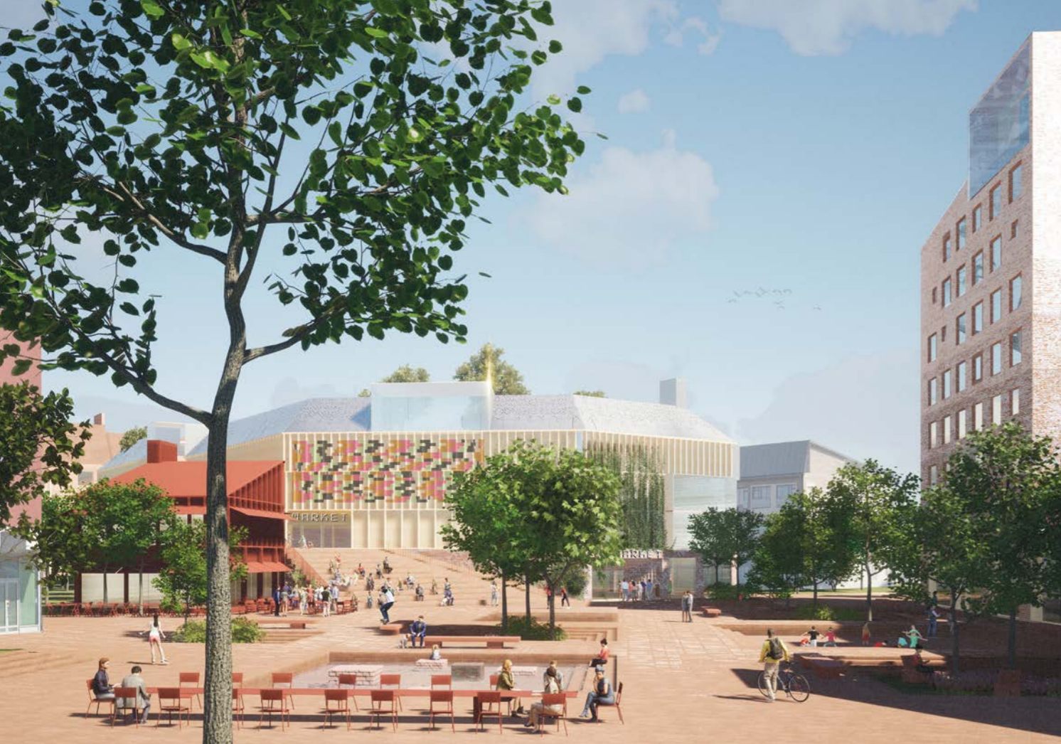
näkymä Vuoresaukiolta / view from Vuoresaukio