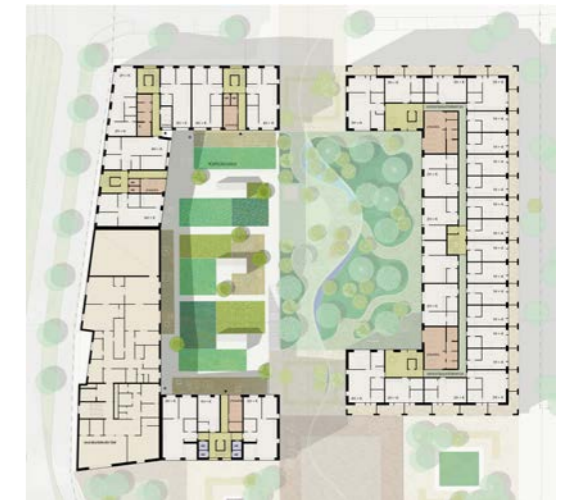
hybridikortteli, asuinkerros / hybrid block, residential floor 1:2000