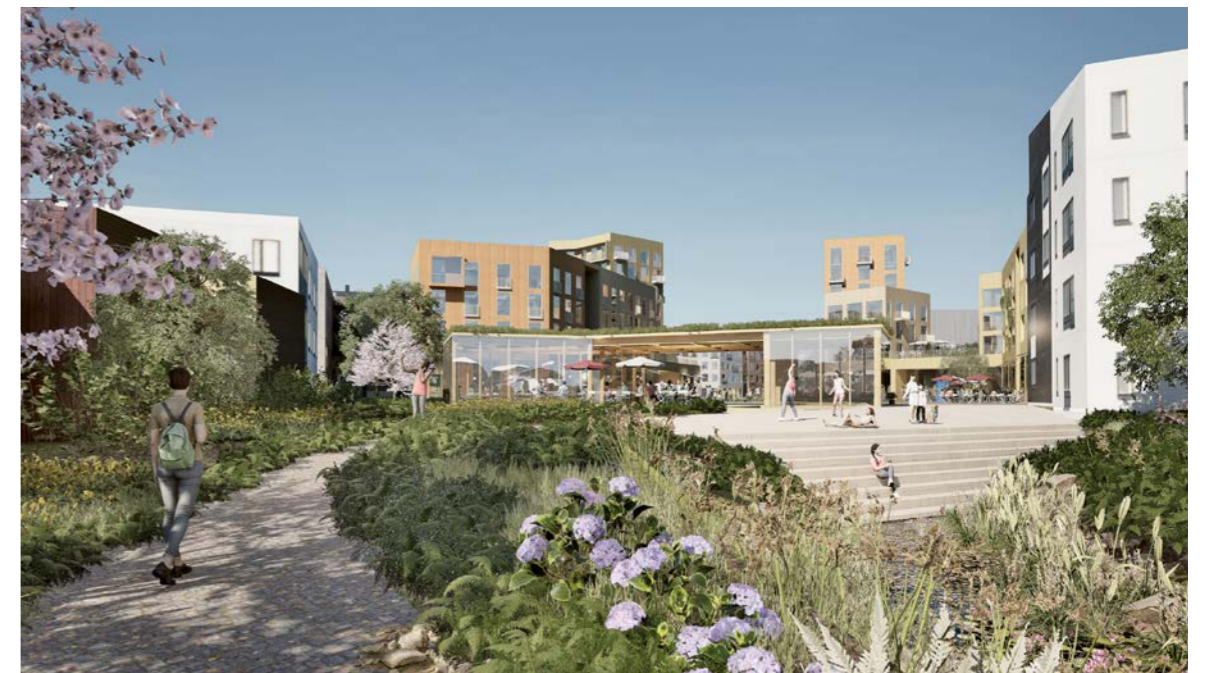
näkymä puistosta Vuoresaukion suuntaan / view from the park towards Vuoresaukio

tekijät / authors: ELINA AHDEOJA arkkitehti SAFA MIKA SAARIKANGAS rakennusarkkitehti AMK MIKKO SILTANEN arkkitehti SAFA