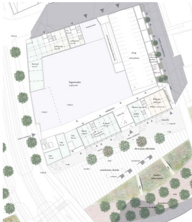
hybridikortteli, maantasokerros ja liittyminen Vuoresaukioon / hybrid block, Vuoresaukio level 1:1500