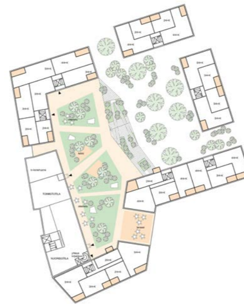
hybridikortteli, asuinkerros / hybrid block, residential floor 1:1500