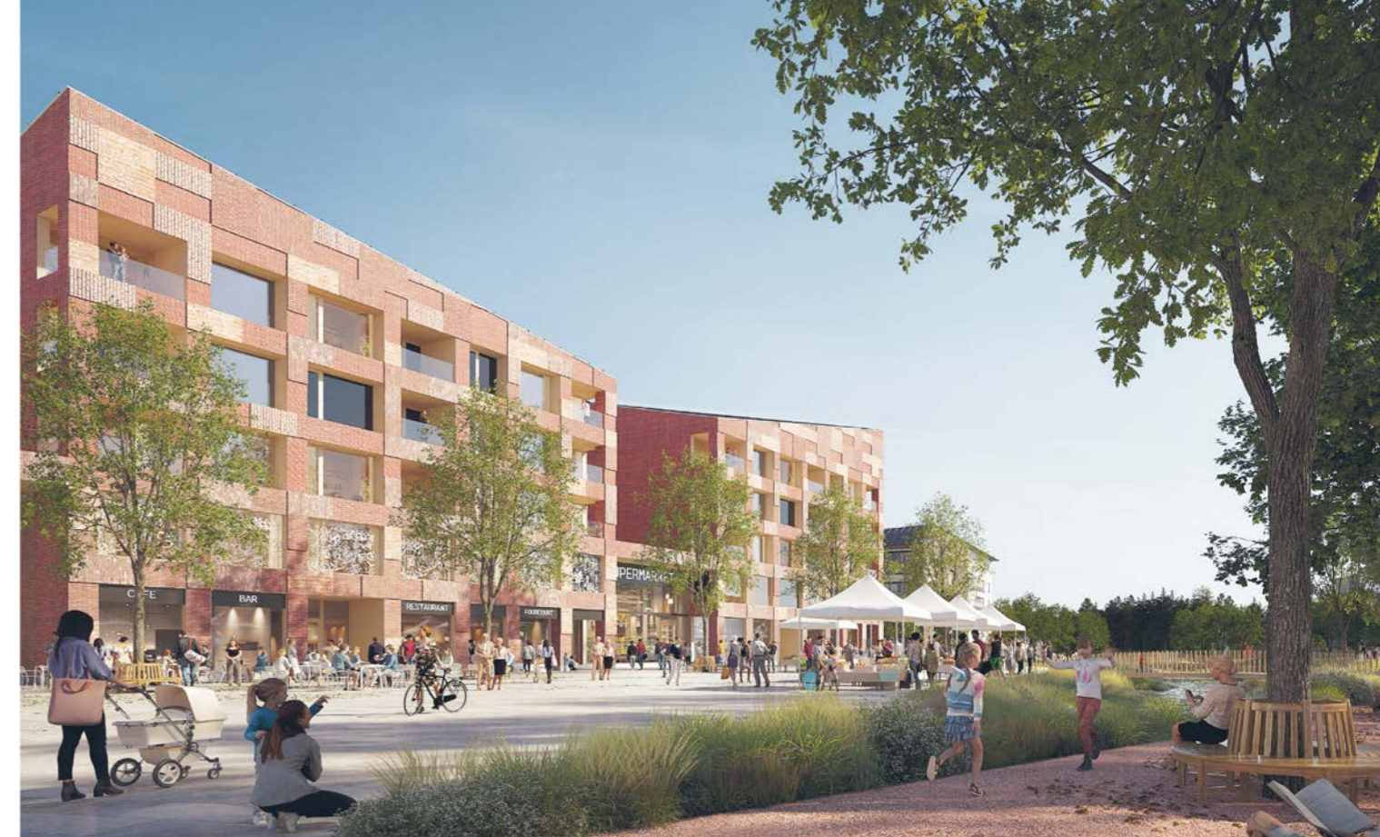
näkymä Vuoresaukiolta / view from Vuoresaukio