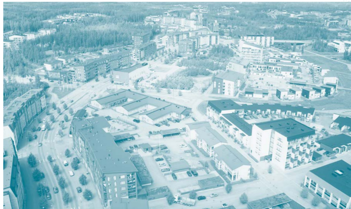
kilpailualue / competition area

— kilpailualue / competition area ..... tarkastelualue / examination area