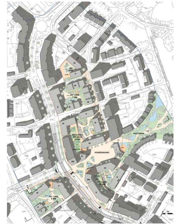
yleissuunnitelma / general plan 1:4000