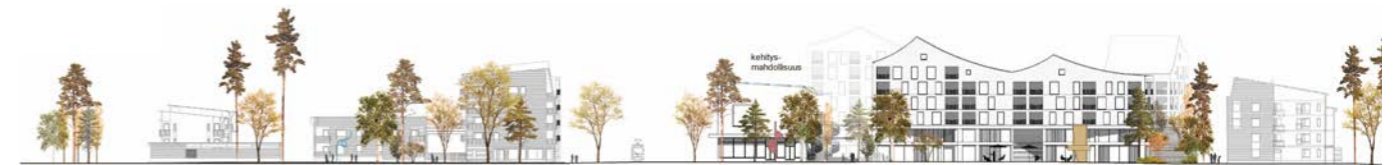
aluejulkisivu / elevation, Koipitaipaleentie–Vuoresaukio 1:1500