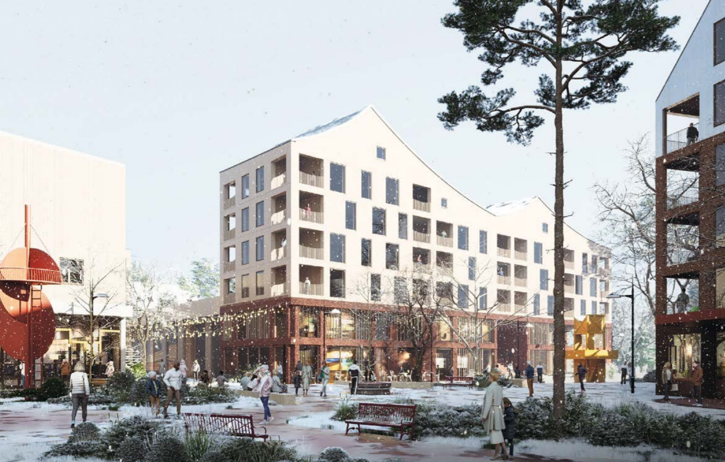
näkymä Vuoresaukiolta / view from Vuoresaukio