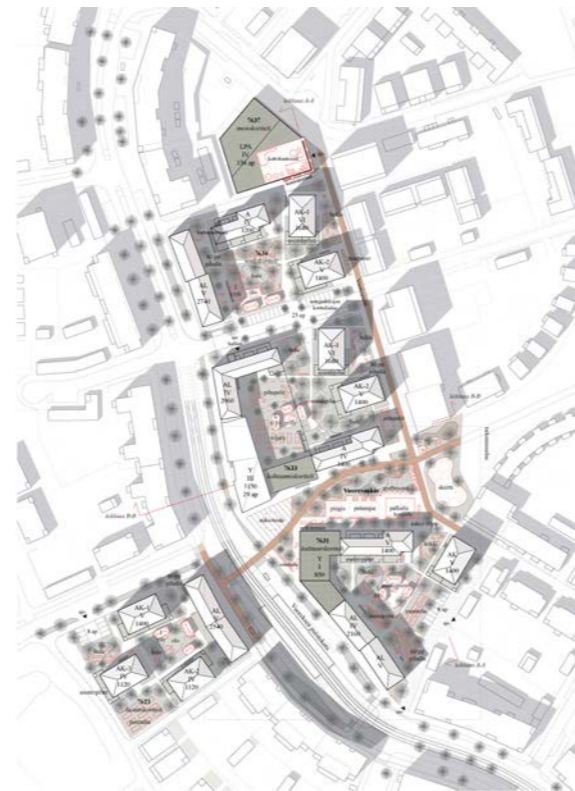
yleissuunnitelma / general plan 1:4000

tekijät / authors: ESSI NISONEN, JOONA LUKKA