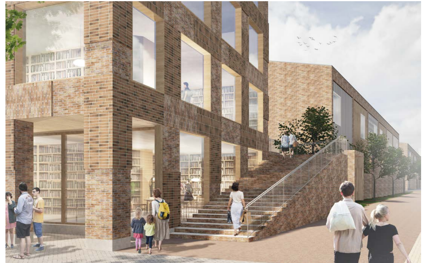
näkymä kirjaston kulmalta / view towards the library