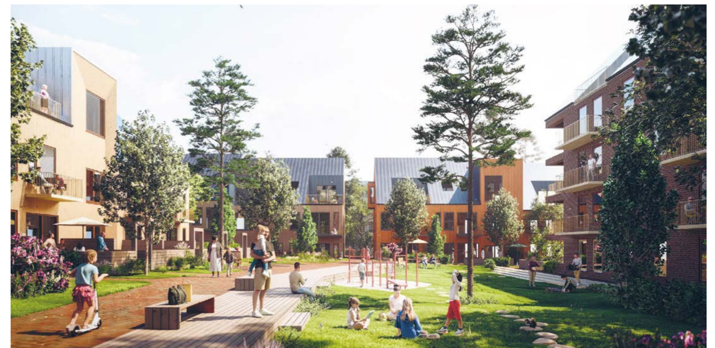
korttelin sisäpiha / courtyard

JOSEFINE ASKFELT maisema-arkkitehti LAR/MSA ANNA KRASSUSKI maisema-arkkitehti LAR/MSA