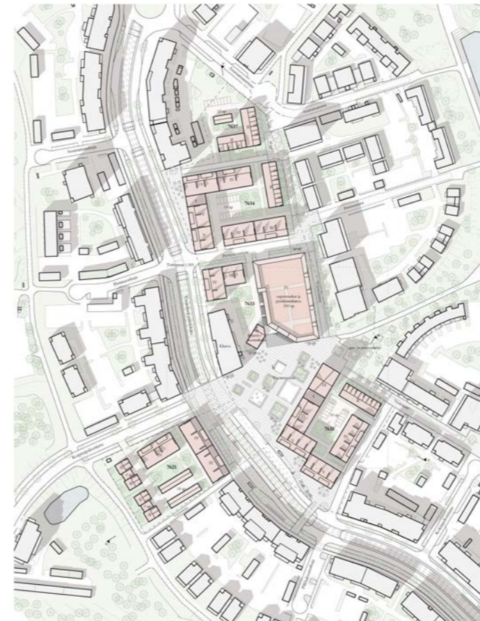
yleissuunnitelma / general plan 1:4000