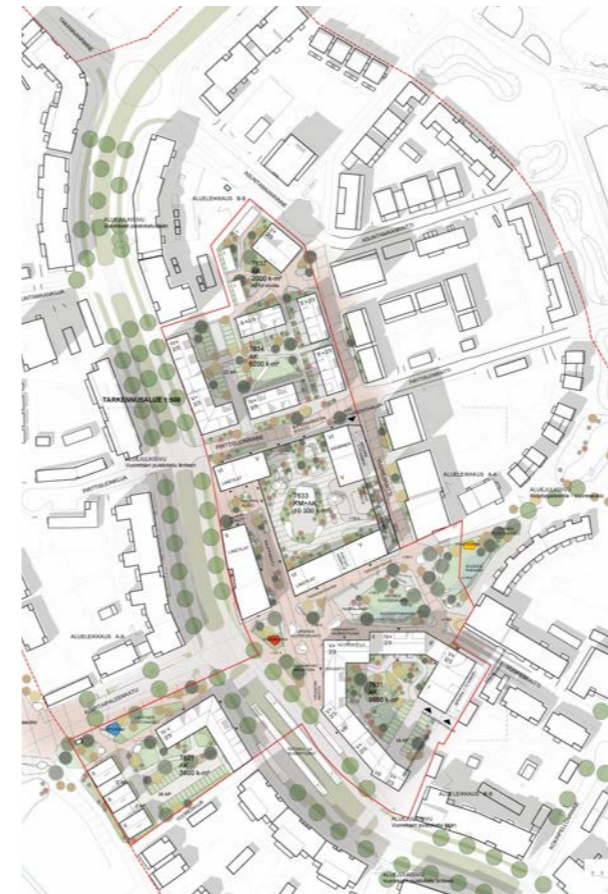
yleissuunnitelma / general plan 1:4000