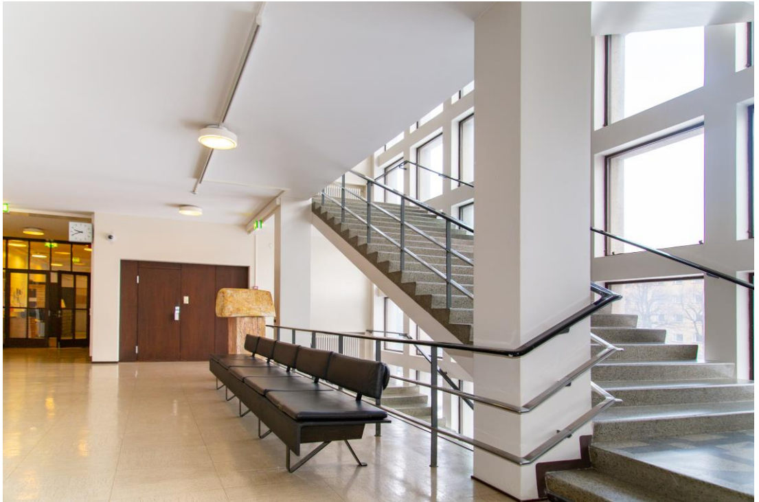
Kaupungintalon portaikko, 2023.