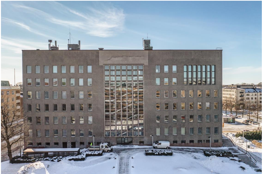
Kaupungintalo Rauhankadun suuntaan, 2023.