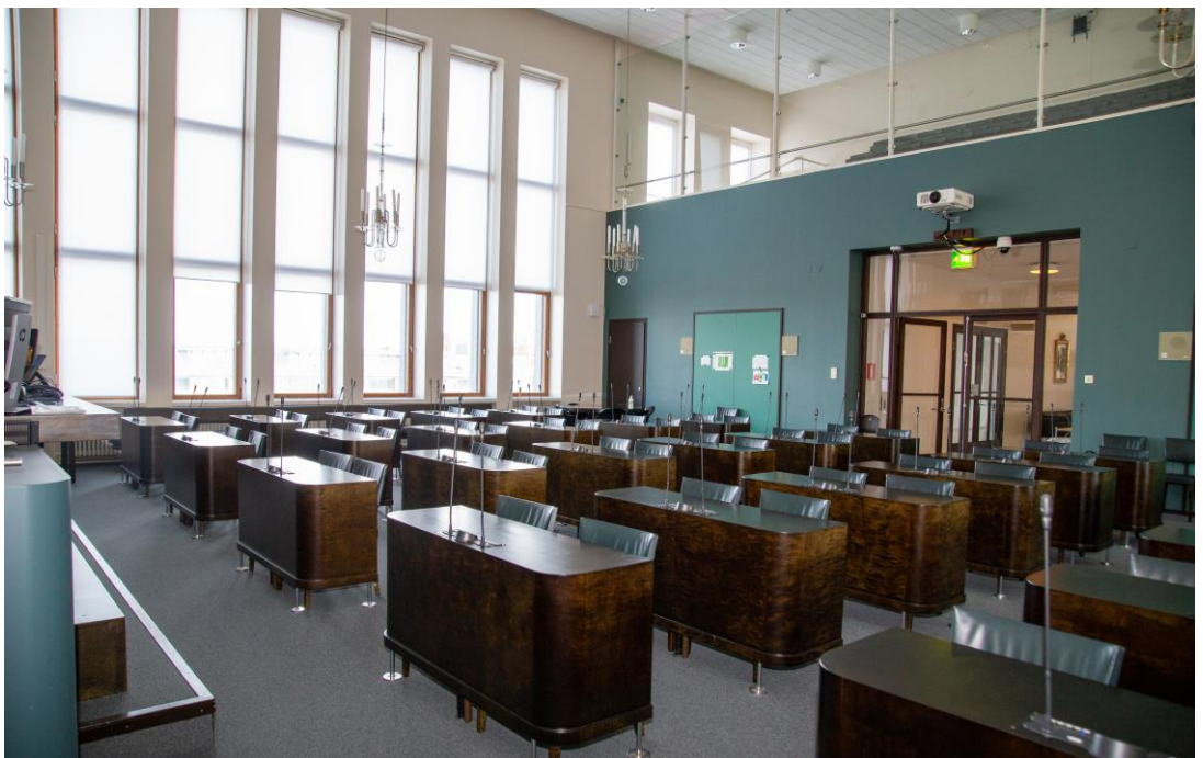
Kaupungintalo valtuustosali, 2023.