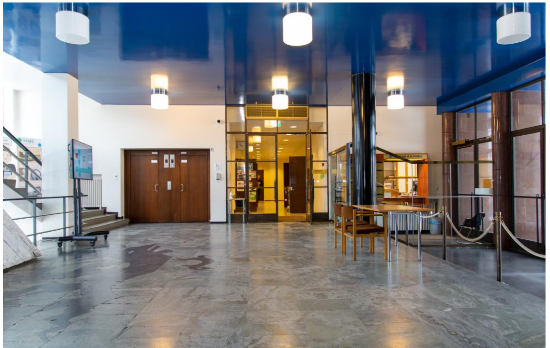
Kaupungintalon ala-aula, 2023.

Kaupungintalo tulee jatkossakin olemaan hallinnon ja virastojen käytössä. Painetta on tiivistää tilankäyttöä niin, että ainakin osasta kaupungin henkilöstölle ulkopuolelta vuokratuista toimistotiloista voidaan luopua ja keskittää henkilöstön sijoittumista kaupungintalolle. Osittainen etätyö mahdollistaa uudenlaisen tilankäytön nykyisessä työympäristössä laajemmalle joukolle. Samalla rakennuksesta pitää saada turvallinen niin sisäisille käyttäjille, luottamushenkilöille kuin vierailijoillekin.