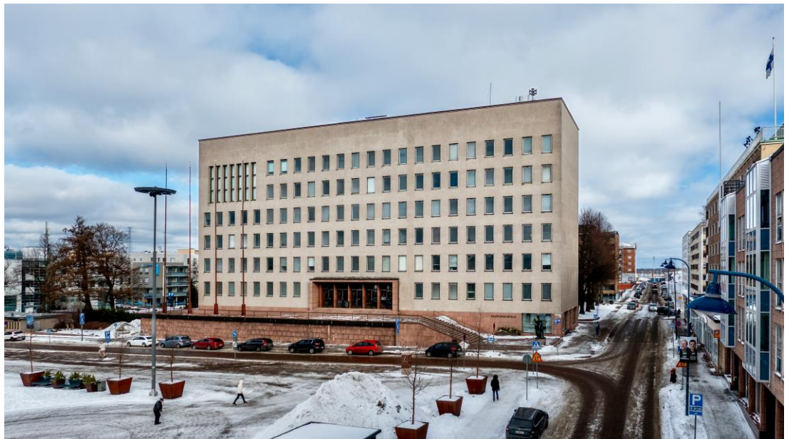
Kaupungintalo kauppatorin suuntaan, 2023.

Kilpailuohjelma liitemateriaaleineen on ladattavissa osoitteessa: www.kotka.fi/arkkitehtuurikilpailu