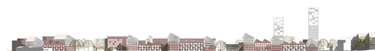
aluejulkisivu / areal elevation 1:3000