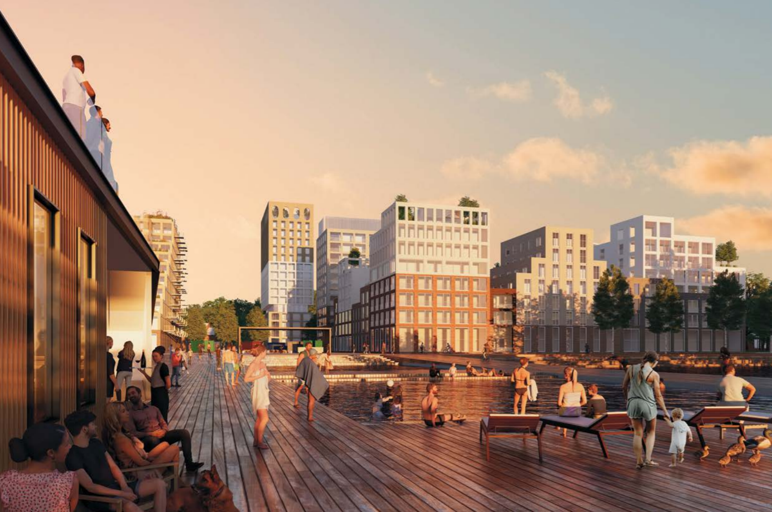
näkymä rantatorille / view towards waterfront square