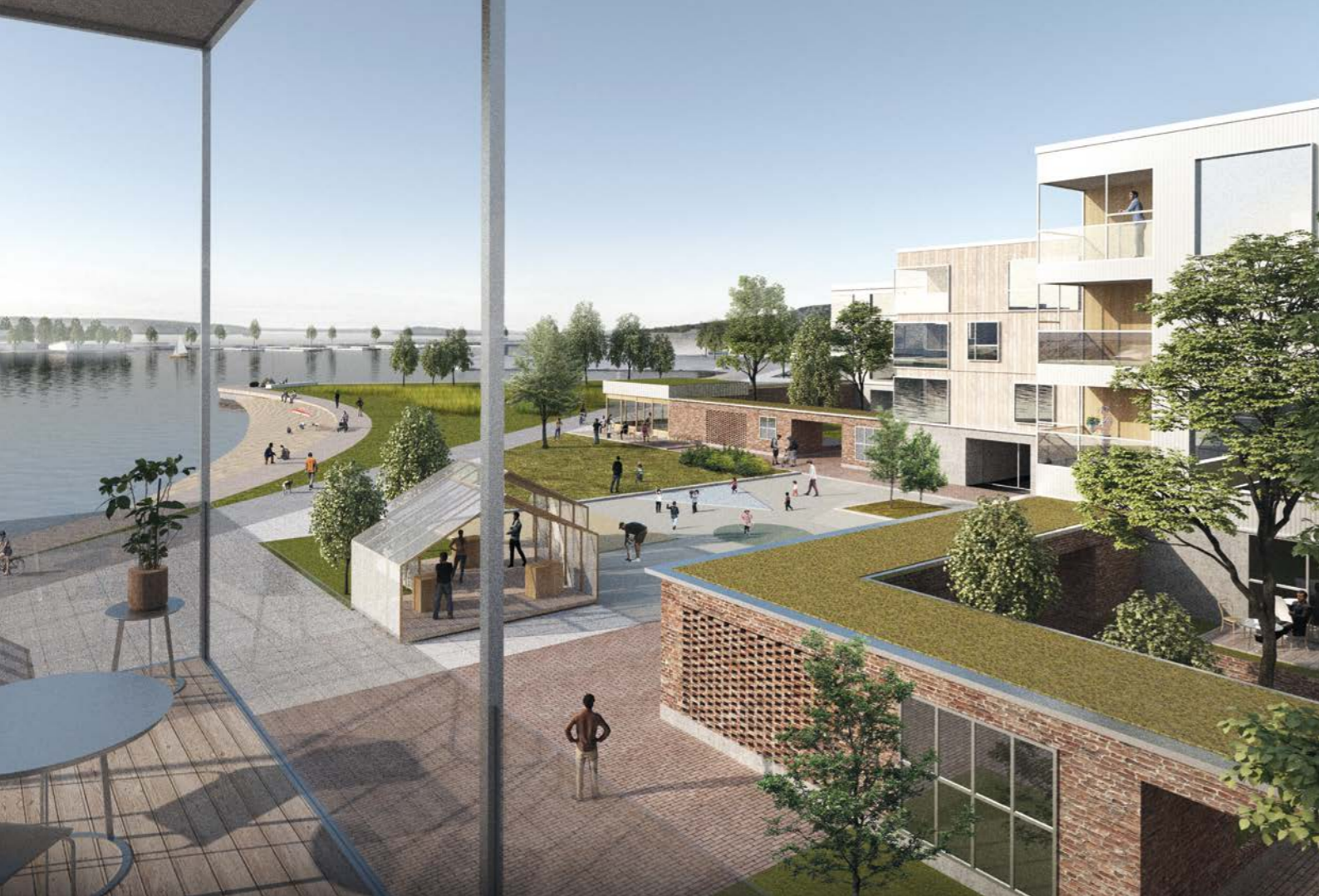
näkymä rantaraitin varreta / view from waterfront route