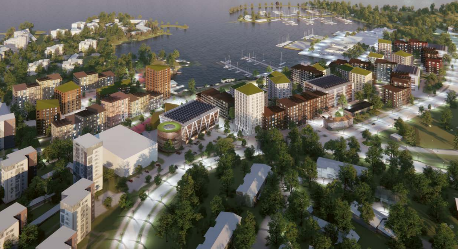
ilmakuva / aerial view