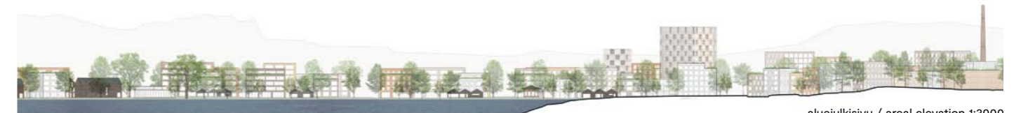
aluejulkisivu / areal elevation 1:3000

tekijät / authors: Sitowise Oy – KIRSI RANTAMA, MAARIT VIRKKUNEN, OLGA AIRAKSINEN, EERO PUURUNEN arkkitehteja / architects SAFA MARIKA BREMER maisema-arkkitehti / landscape architect LINDA KAIRA maisema-arkkitehtiopiskelija / student of landscape architecture ELINA NYKÄNEN, MIKKO VUORINEN liikennesuunnittelijoita / traffic planners ANSELMI MOISANDER arkkitehtiopiskelija / student of architecture ANDREA ESQUIVEL VELÁSQUEZ arkkitehti / architect SINI MÄKINEN teollinen muotoilija / industrial designer Lindroos Architects Oy – OSMA LINDROOS arkkitehti / architect SAFA