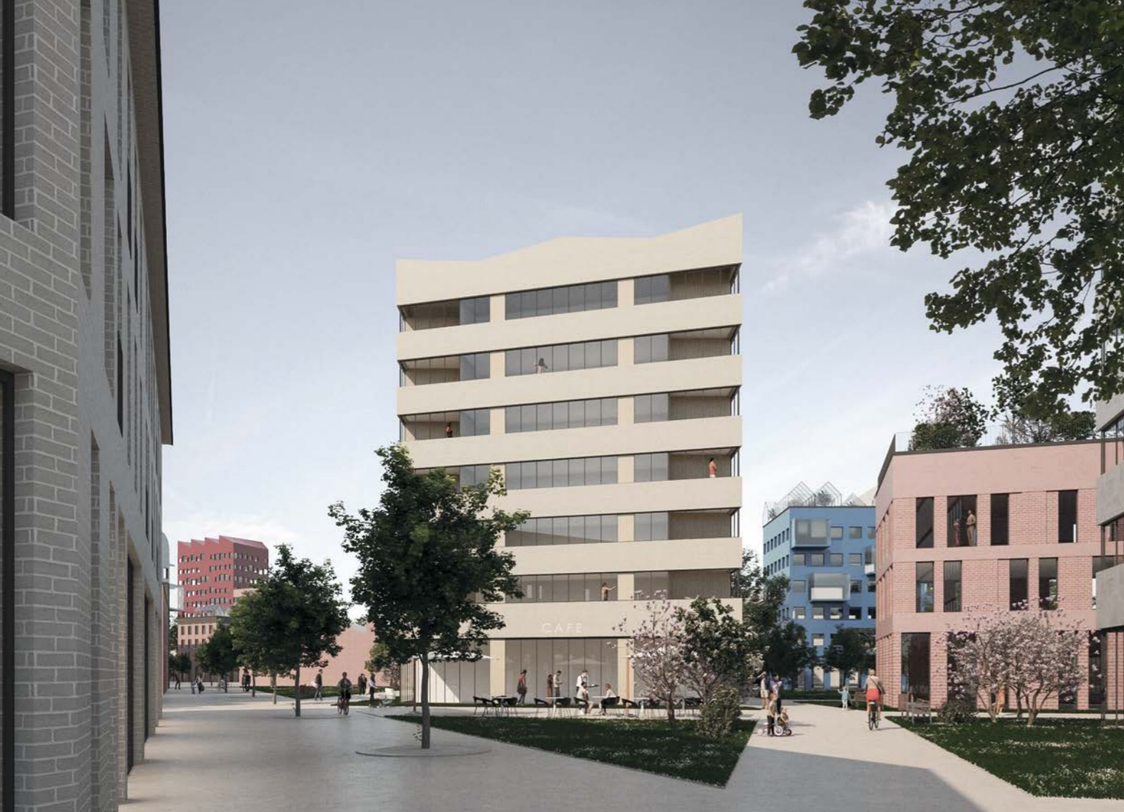
näkymä keskusraitilta / view from shared space street