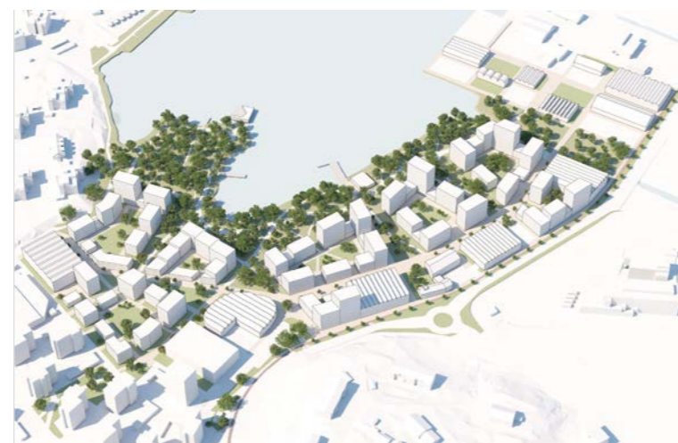
ilmakuva / aerial view

tekijät / authors: Futudesign Oy – TEEMU SEPPÄNEN, ALEKSI NIEMELÄINEN, MARCUS KUJALA arkkitehteja / architects SAFA