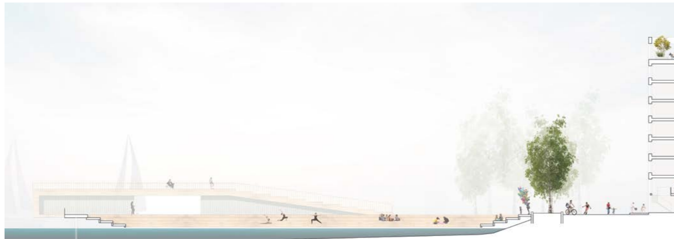
leikkaus, rantapromenadi / section, waterfront route 1:600