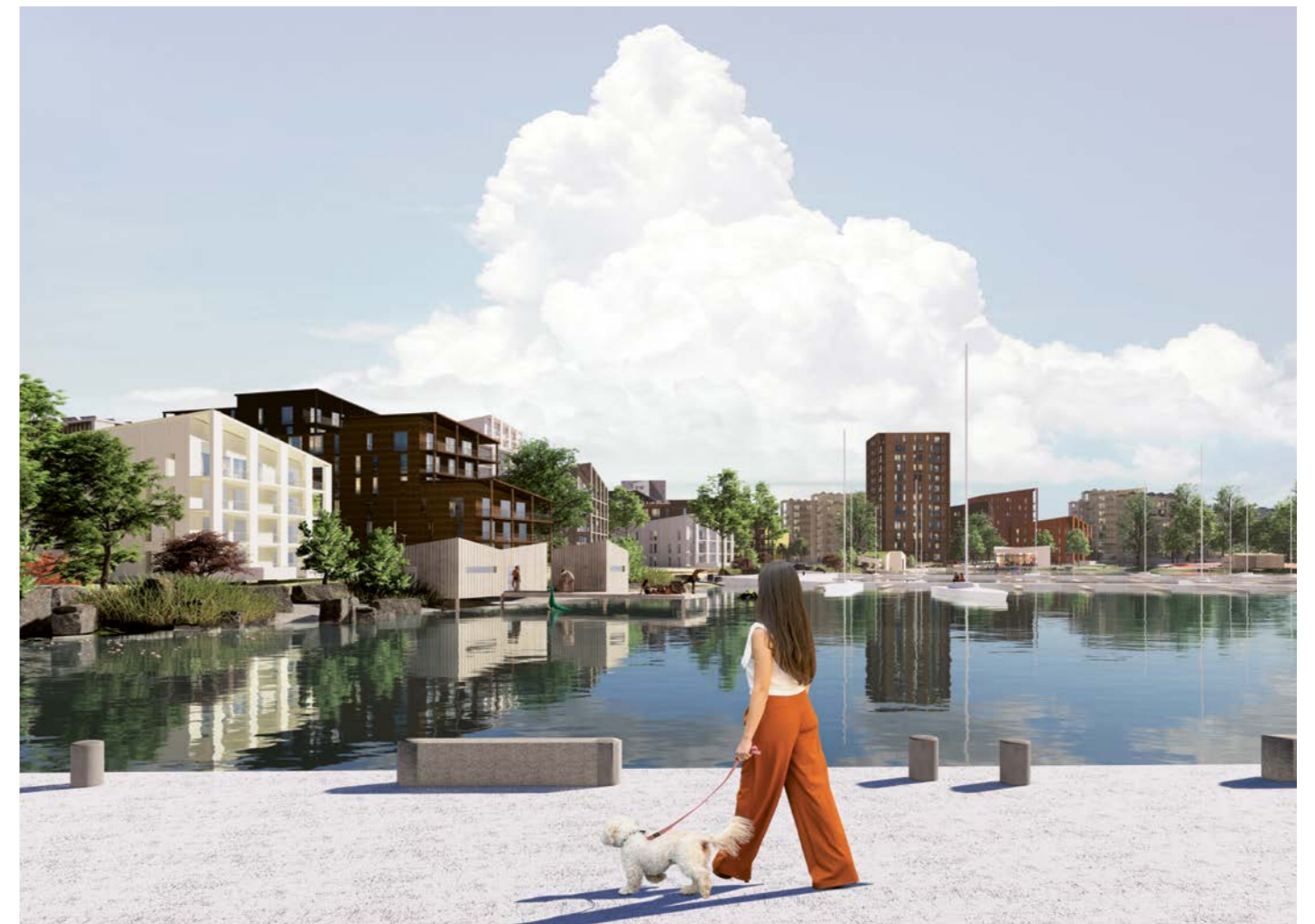
näkymä tapahtuma-aukiolta Siiloaukiolle / view from events square towards Siiloaukio square