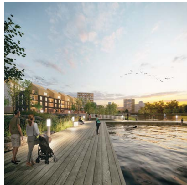
nakymä rantapuistosta / view from waterfront park

työryhmä / team: Lukkaroinen Arkkitehdit Oy – SATU FORS, PETRI PETERSSON, SIMO RASMUSSEN arkkitehteja / architects HEINI KASKELA arkkitehti / architect SAFA TEA KEMPPAINEN mediatekniikan insinööri / media engineer Sitowise Oy – JANI KARJALAINEN liikenneasiantuntija / traffic specialist NollaE Oy – NIKOLAS SALOMAA, RISTO MERIKKINIEMI energia-asiantuntijoita / energy specialists