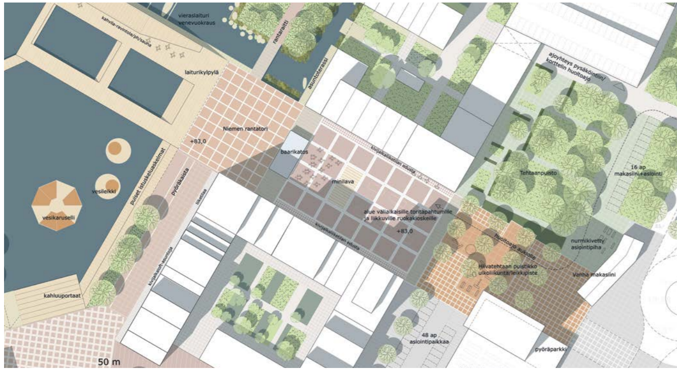
osa-alesuunnitelma, rantatori / sub-area plan, waterfront square 1:1500