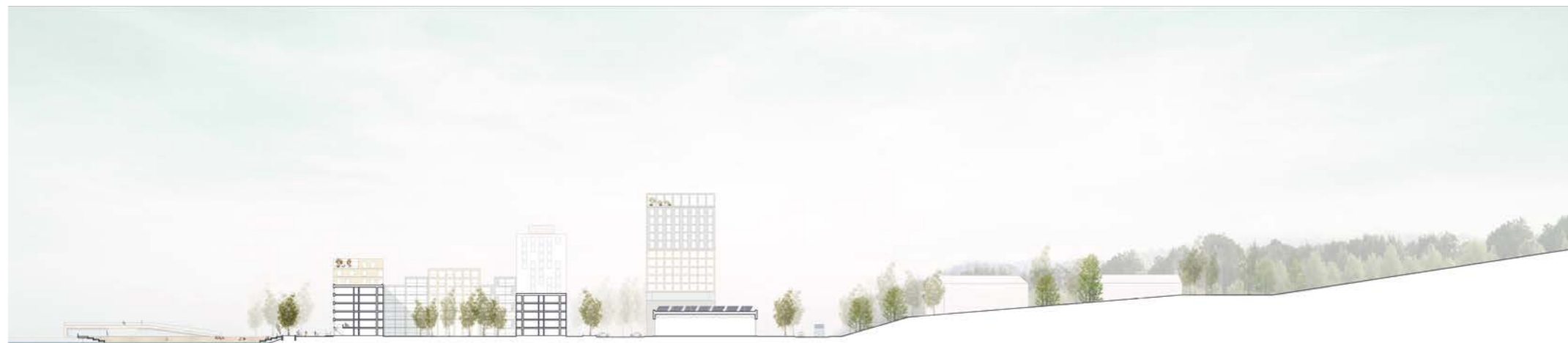
leikkaus / section 1:2000