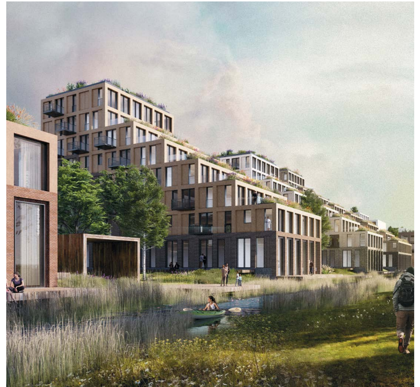
näkymä rantapuistosta asuinkorttelien suuntaan / view from waterfront park towards housing blocks