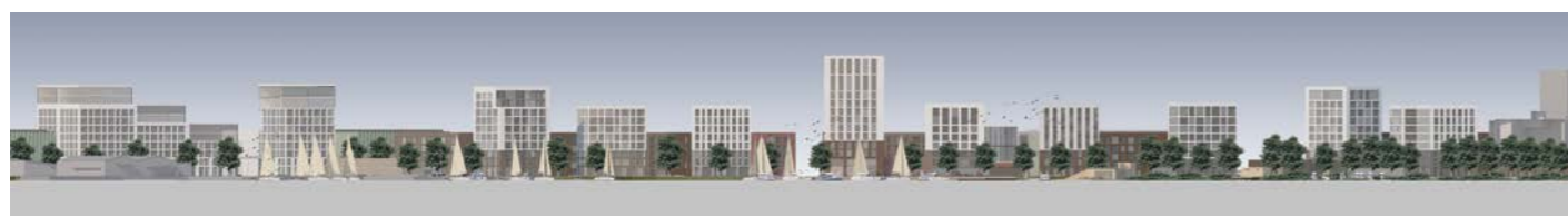
aluejulkisivu / areal elevation 1:3000