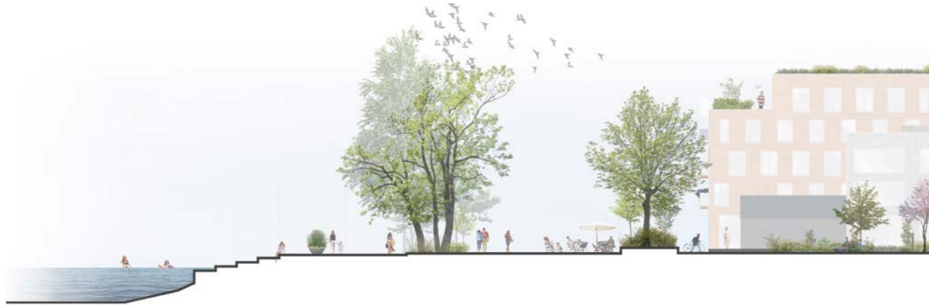
leikkaus, ranta-aukio / section, waterfront square 1:500