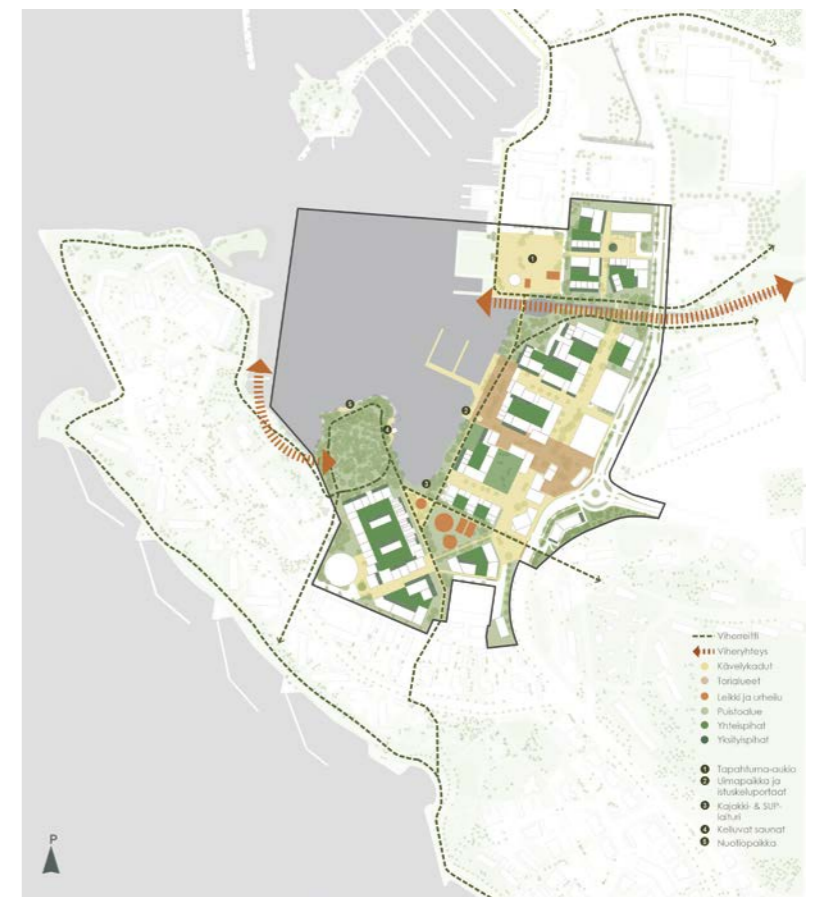
viheralueet, reitit ja julkiset ulkotilat / green areas, routes and public spaces 1:10 000