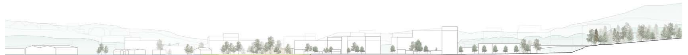
leikkaus / section 1:2000