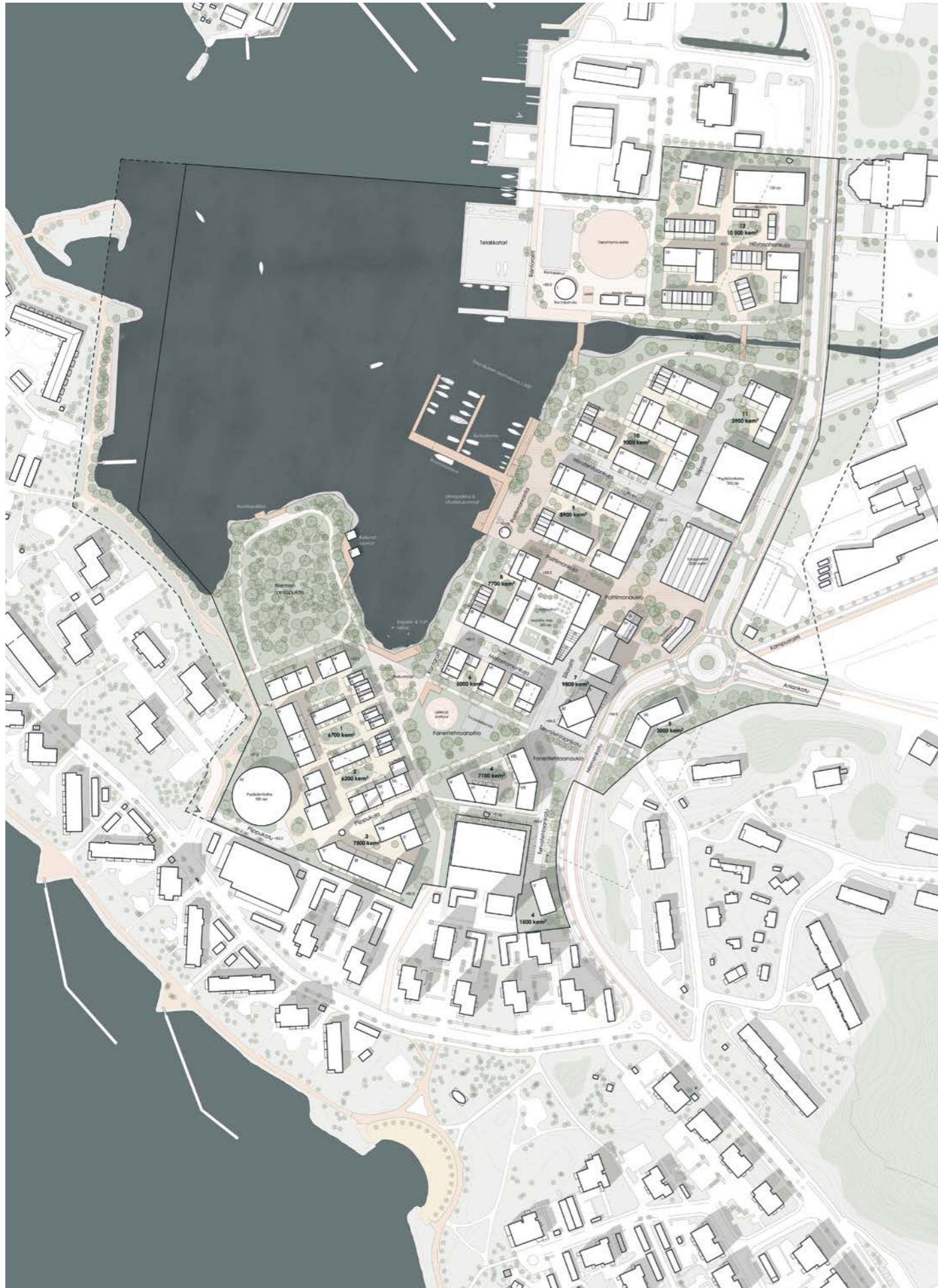
kokonaissuunnitelma / general plan 1:4000