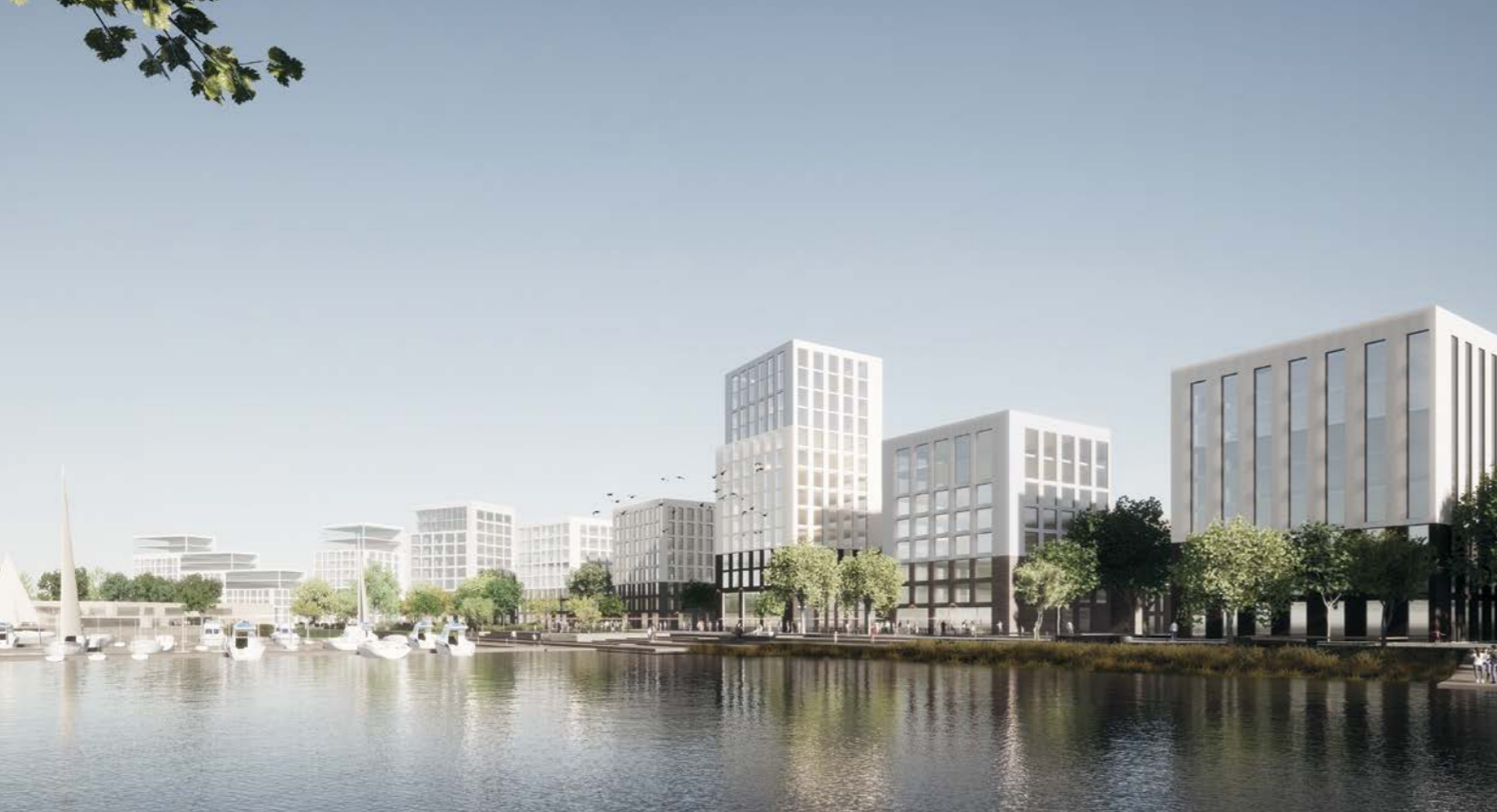
nakymä uimapaikalta rantaraitille / view towards waterfront route