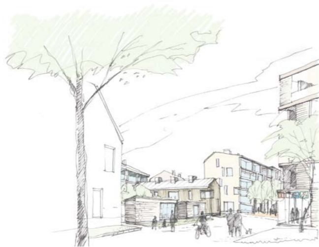
näkymä / view

tekijät / authors: Inaro Integrated Architecture Office – SAMI HEIKKINEN arkkitehti / architect SAFA ANNA-KAISA AALTO maisema-arkkitehti / landscape architect MARK työryhmä / team: VILLE MELLIN, LASSI LUOTONEN arkkitehteja / architects SAFA JUHA RIIHELÄ, PEDRO LOURO arkkitehteja / architects MIIA SUOMELA arkkitehti, VTK (viestintä) / architect, B.Soc.Sc (communication) VIKTORIA MAZAEVA suunnitteluavustaja / design assistant