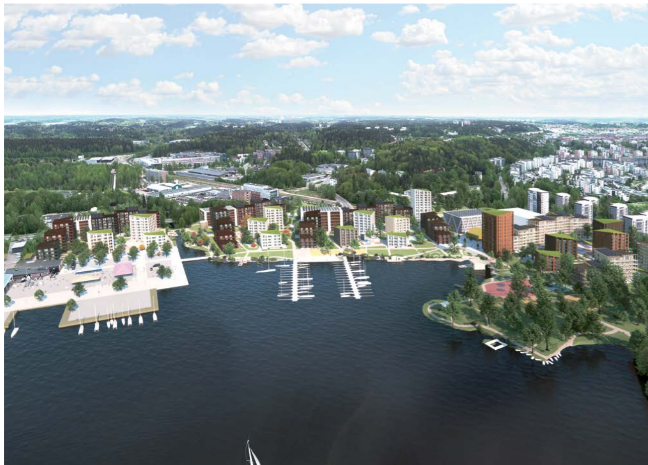
ilmakuva / aerial view