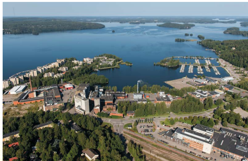
kilpailualue / competition area