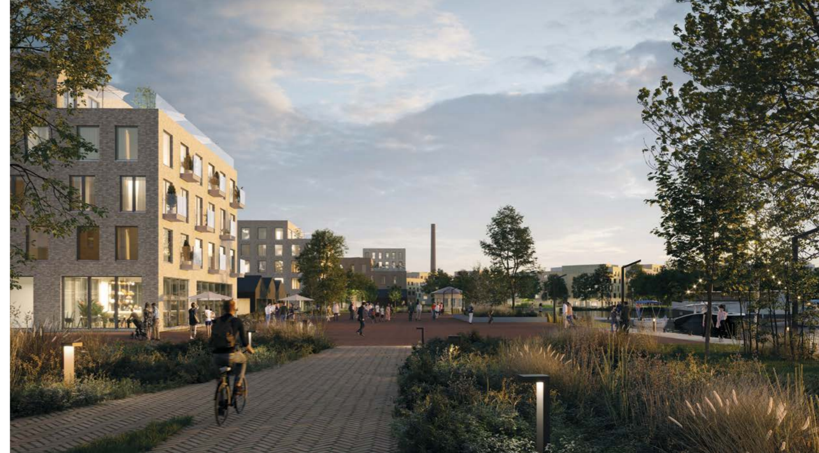
rantaraitti / waterfront route