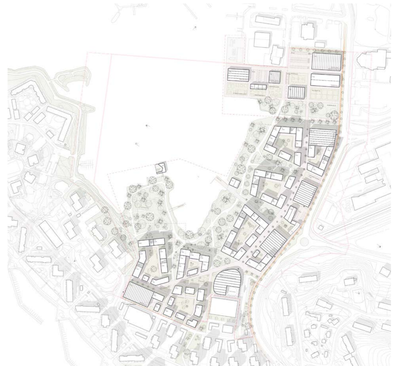
kokonaissuunnitelma / general plan 1:5000