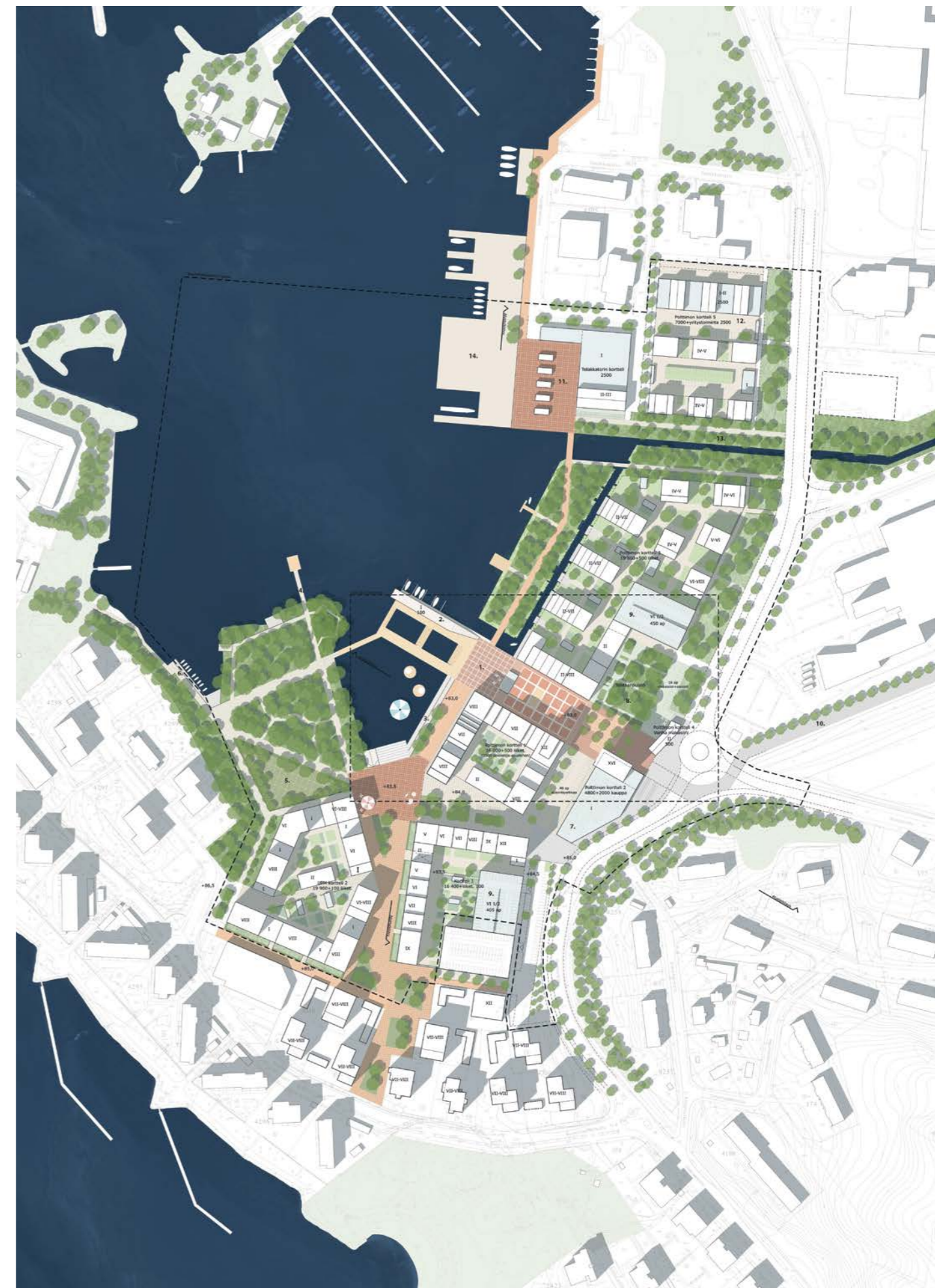
kokonaissuunnitelma / general plan 1:4000