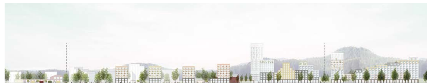
aluejulkisivu / areal elevation 1:3000

tekijät / authors: Arkitehdit Anttila & Rusanen Oy – MIKKO RUSANEN, JESSE ANTILA, NOORA LAHDENPERÄ, MARIUS SAVICKAS, SALVADOR GAZGA arkkitehteja / architects SAFA