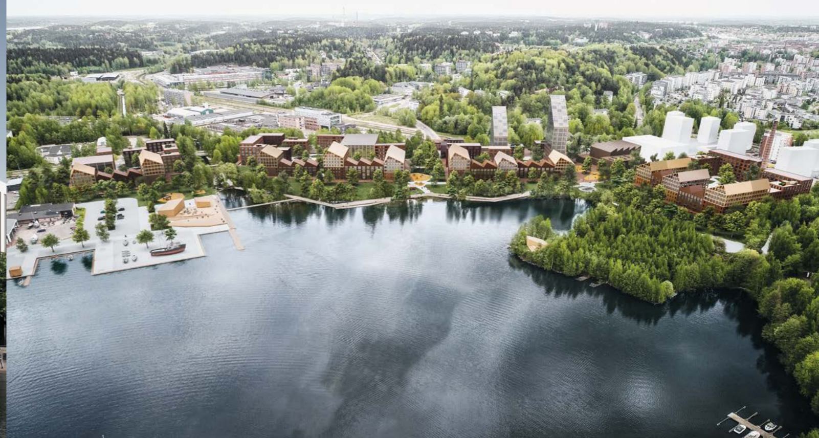
ilmakuva / aerial view