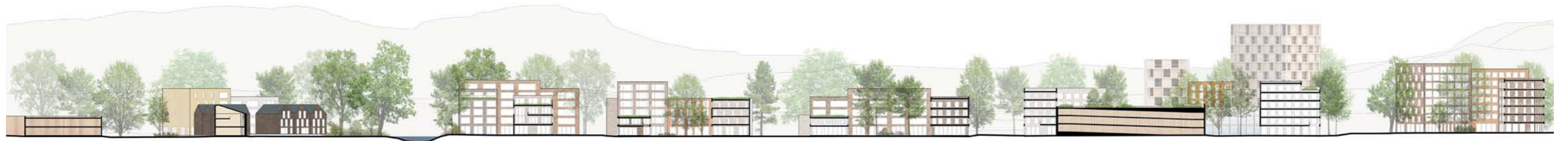
leikkaus / section 1:1500