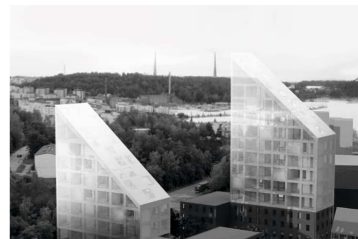
maamerkit / landmark buildings

tekijät / authors: Arkkitehtuuri Noan – JANNE EKMAN, TEEMU PAASIAHO, LASSI VIITANEN arkkitehti / architects SAFA avustajat / assistants: CASPAR ÅKERBLOM, JAAKKO HEIKKILÄ, JANI JUKONEN