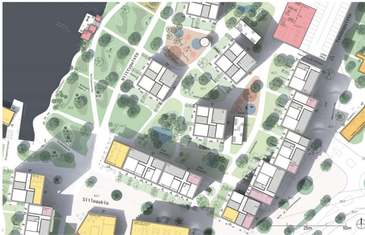
osa-alue suunnitelma, asuminen / sub-area-plan, housing blocks 1:1500