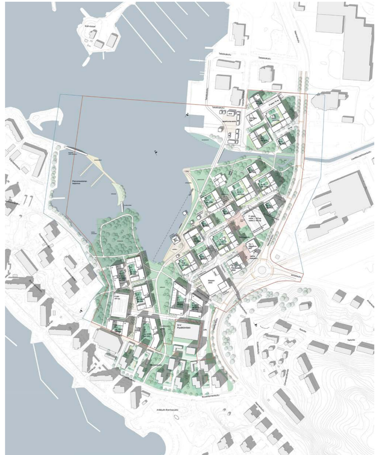
kokonaisuunnitelma / general plan 1:5000