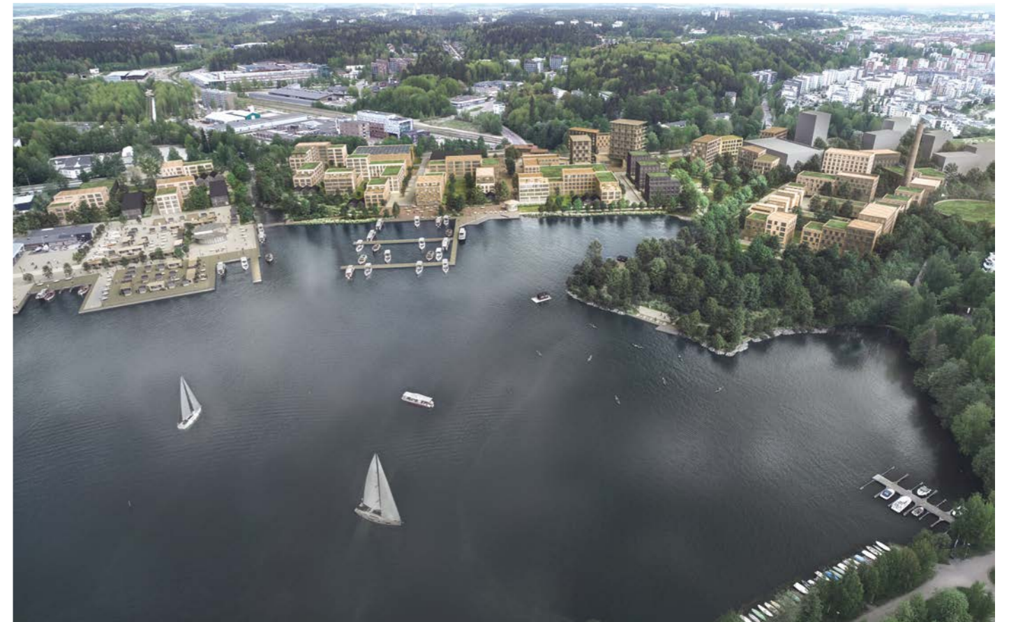
ilmakuva / aerial view