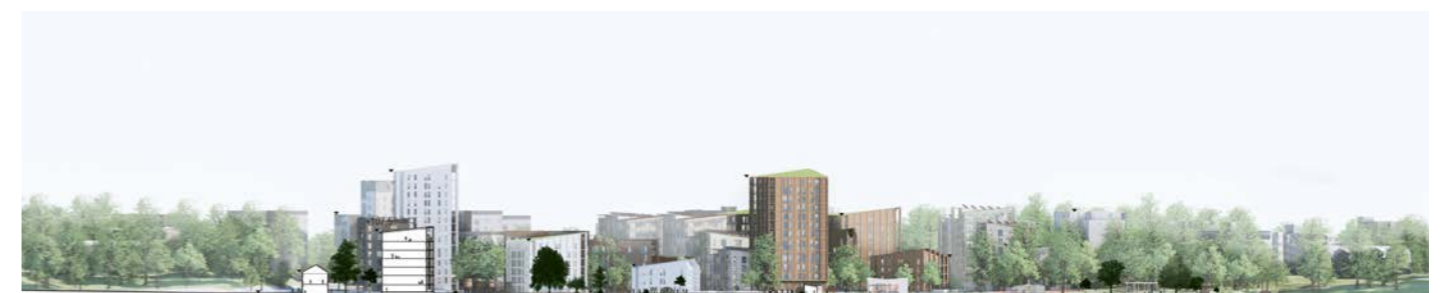
leikkaus / section 1:2500