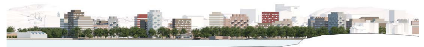
aluejulkisivu / areal elevation 1:3000