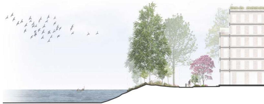
leikkaus, rantaraitti / section, waterfront route 1:500