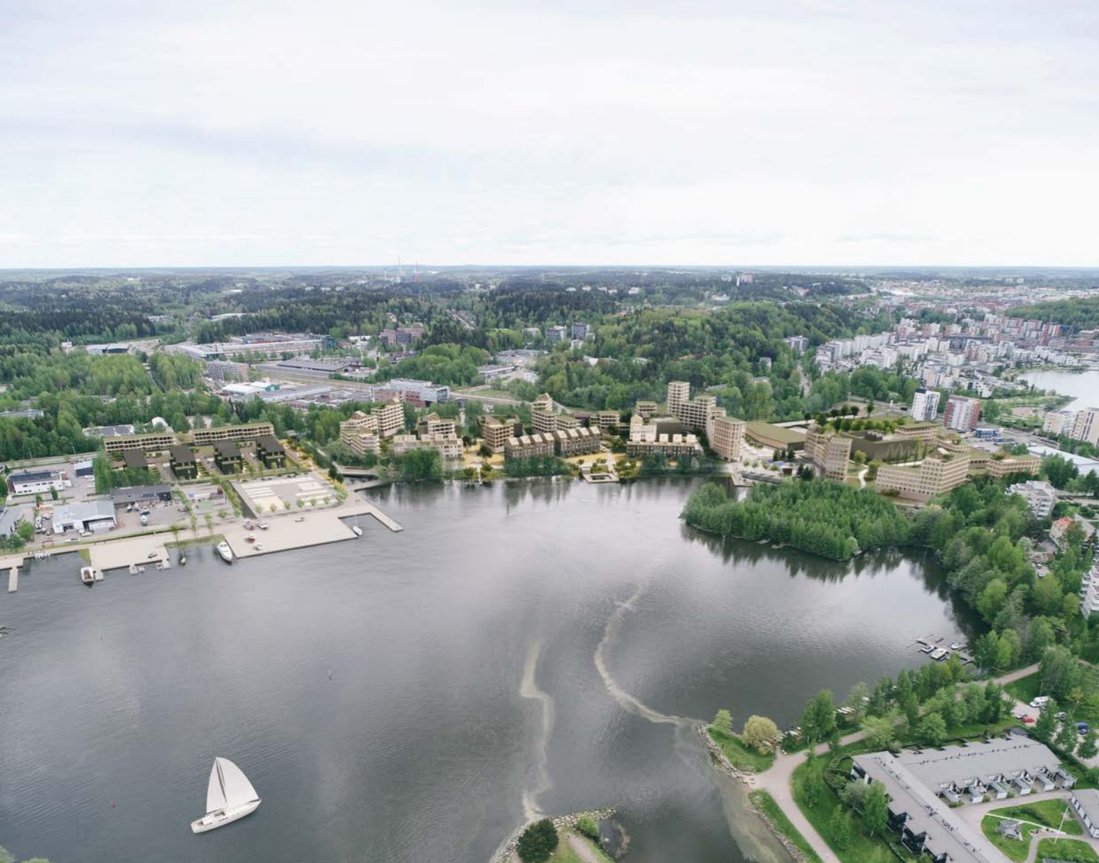
ilmakuva / aerial view