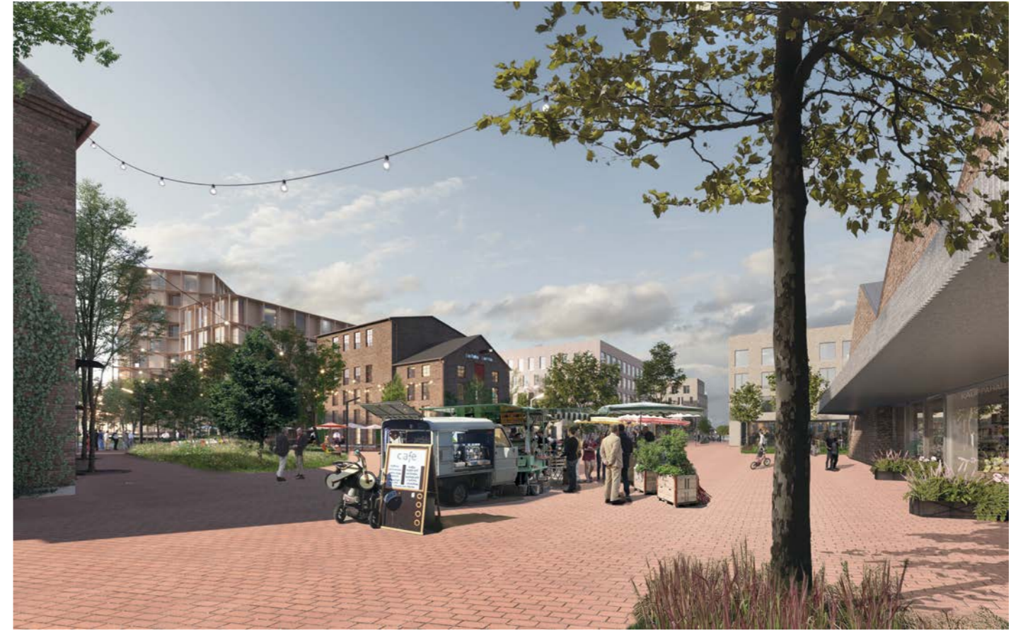
näkymä pääaukiolta / view from main square