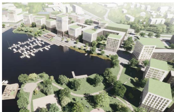
ilmakuva / aerial view

tekijät / authors: Arkkitehtuuri Olark Oy – LASSE OLASTE maisema-arkkitehti / landscape architect