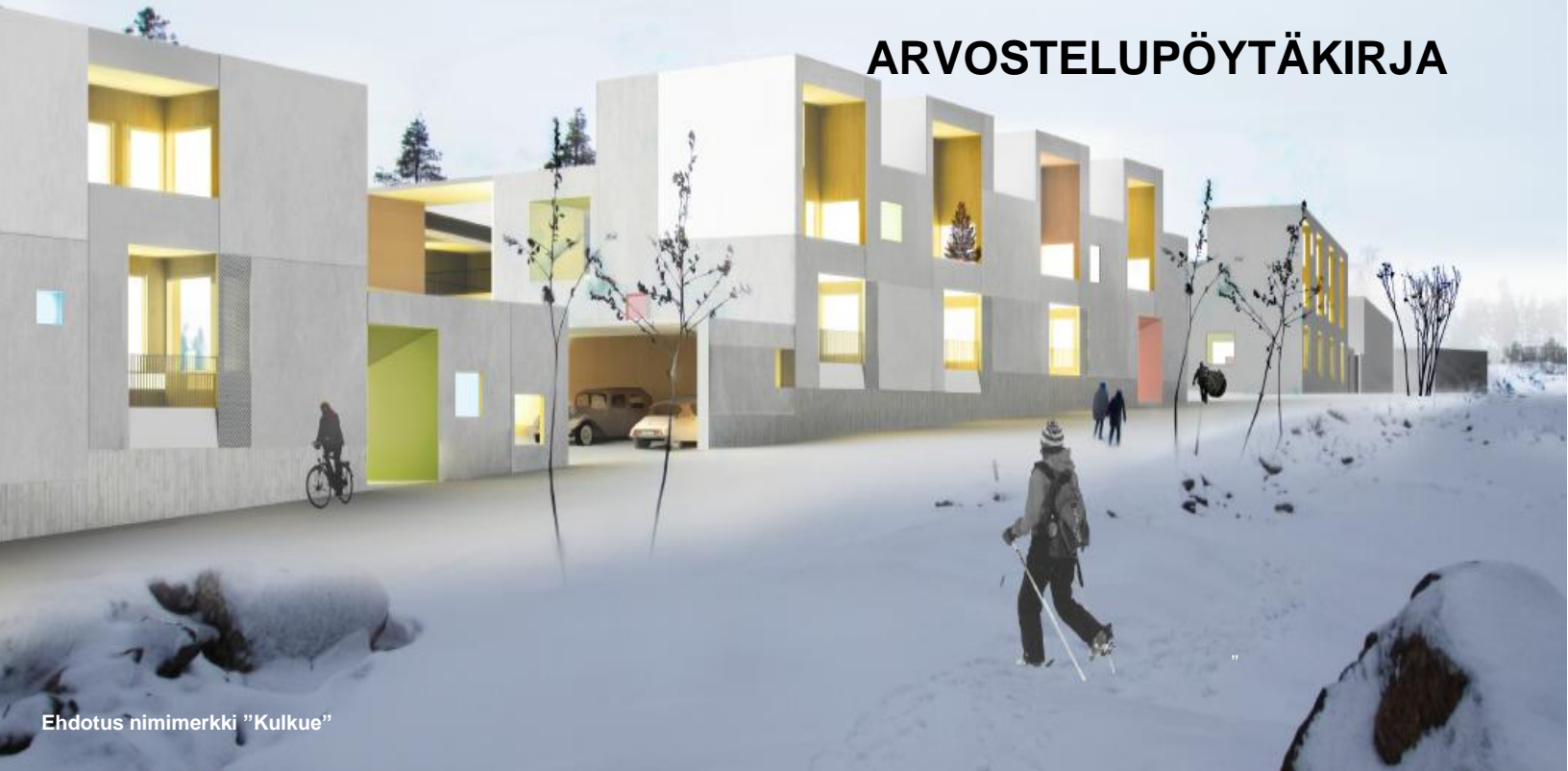
Ehdotus nimimerkki "Kulkue"