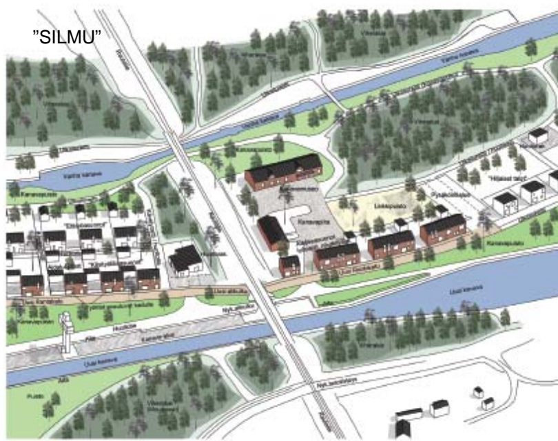
HAVAINNEKUVA KANAVA-ALUEelta 1:1000

Asutopainotteinen ratkaisu, jossa rakentamistapa tuo identiteettiä alueelle. Hauska esitystapa ja idea asukkaiden kortteileista, mutta kilpailun tavoitteissa määritelty kokonaisanti jää vaatimattomaksi. Muuten varovainen ratkaisu pääsi unohtamaan joitakin suojelualueita.