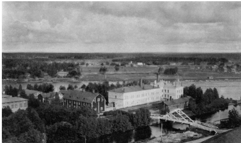
Kuva 2: Lasaretinsaaren lääninsairaala 20-luvulla.

Kilpailun kohteena oleva kaunis Lasaretin puistomainen alue sijaitsee Myllytullin kaupunginosassa, Oulujoen varressa, Ainolanpuiston ja Hupisaarten puistoalueen kainalossa, aivan lohিপatojen vieressä. Lasaretinsaaren historialliset rakennukset ja maisemakokonaisuus luovat alueelle omaleimaisen ilmeen. Lasaretin alue on yksi Pohjois-Pohjanmaan merkittävimmistä kulttuurihistoriallisista kohteista.