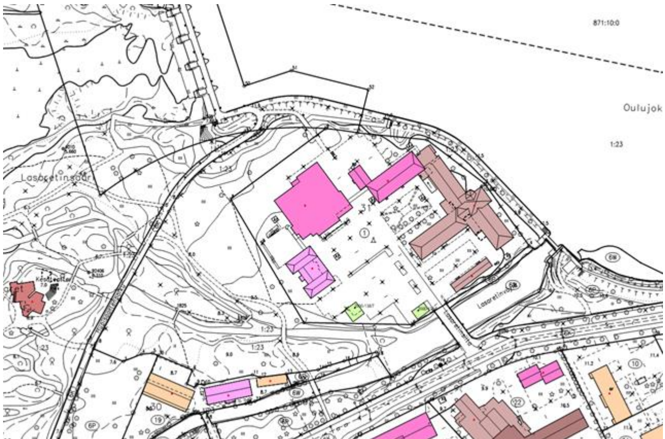
Ote kantakartasta.