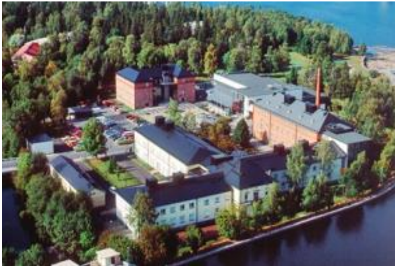
Kuva 3:Lasareti saari.

Vuoden ympäristörakenne -palkinnon, jonka myönsivät Puutarhaliitto ry, Rakennusteollisuus ry ja Tuoteteollisuusjaosto.